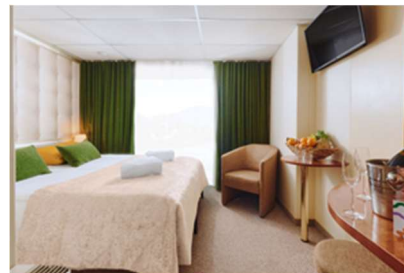
Cabina esterna con balcone alla francese