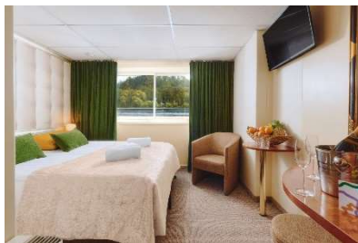
Cabina con finestra apribile