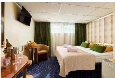
Cabina con finestra fissa