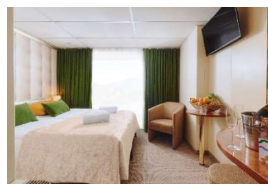
Cabina con balcone alla francese